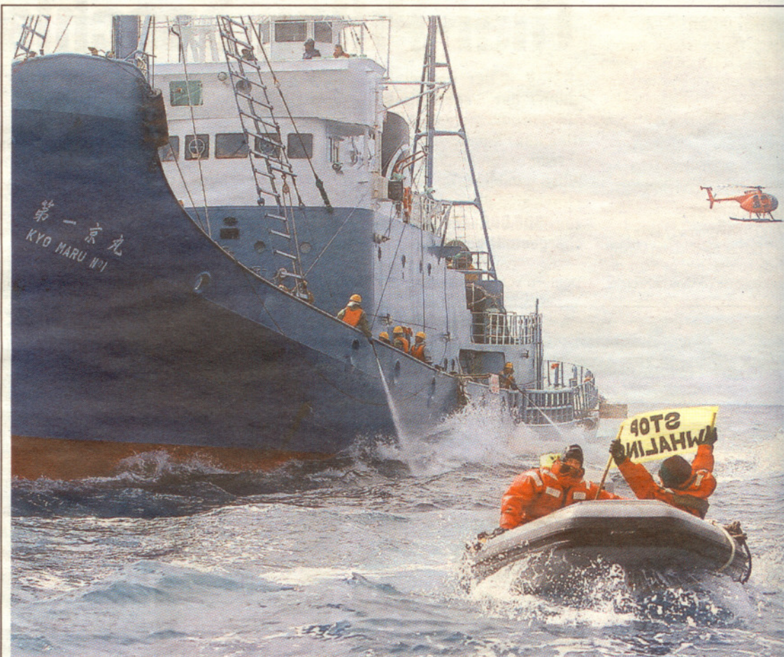
Kampf auf hoher See: Japanische Walfänger spritzen Greenpeace-Aktivisten mit Wasser ab.

sondern es dort auch schön haben. Br. «Luxusreisen und Übernachtungen in Hotel der gehobenen Klasse liegen besonders Trend.» Bei der Swiss läuft auch das Europa-geschäft wie geschmiert. Besonders beliebt sind London und Barcelona. Seit